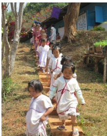
นร.มีบุคลิกภาพที่ดี สะอาดร่าเริง