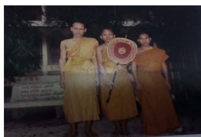
ครูศึกษาพระปริยัติธรรมสอบได้นักธรรมเอก