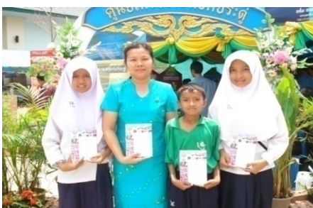
สร้างลูกศิษย์ให้ได้รับรางวัลจากจังหวัดและเขตมากกว่า 200 รางวัล