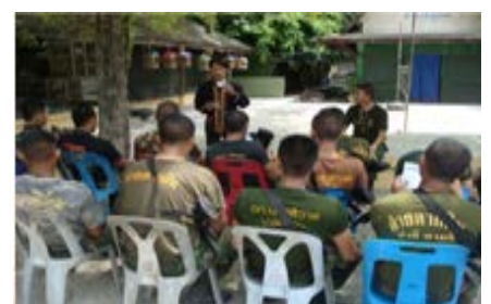
ส่งเสริมการเรียนรู้ภาษาพร้อมกับ สอศด. ในการสอนภาษาให้ทหารในพื้นที่