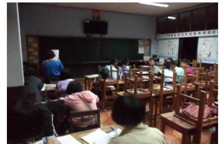
สอนแบบไร้รูปแบบในช่วงกลางคืน