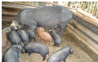
ส่งเสริมการเลี้ยงสุกรแบบลดต้นทุน