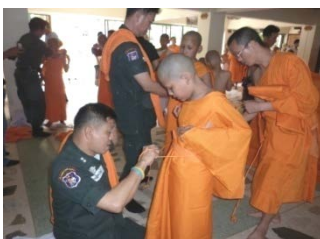
ส่งเสริมให้ นร. ได้บวชเรียนหลังจบ