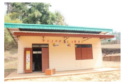
ประสานหน่วยงานภายนอกร่วมสร้างอาคารต่างๆ ของ ร.ร.