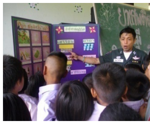
สร้างจิตสำนึกเรื่องภัยยาเสพติดให้ นร.