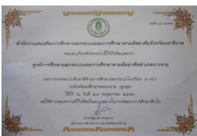
เกียรติบัตรผล N-Net มัธยมปลาย อันดับที่ 1