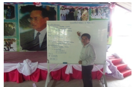
จัดการเรียนการสอนรูปแบบใหม่ SQ3R