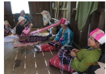
กลุ่มสตรีบ้านห้วยไทร อนุรักษ์ผ้าทอพื้นเมือง