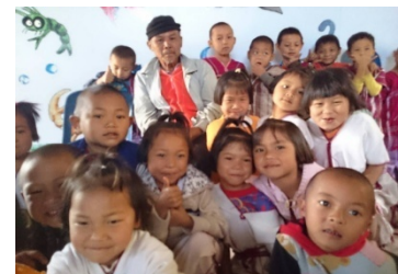
จัดการเรียนรู้เล่าขานตำนาน “ตะบริลี”