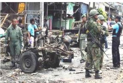
เป็นพื้นที่ที่เกิดความรุนแรงอย่างต่อเนื่อง