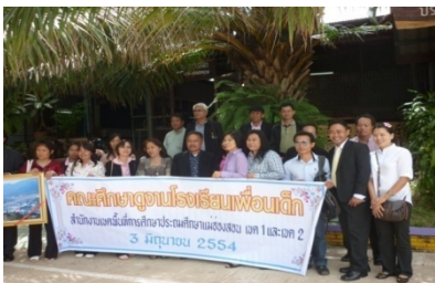
แหล่งศึกษาดูงาน “นวัตกรรมการศึกษา” แห่งเดียวใน