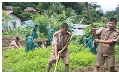
เศรษฐกิจพอเพียง ด้านการเกษตร