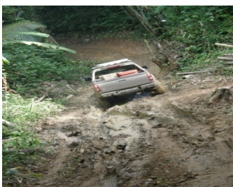
การเดินทางขากลับมากมากในฤดูฝน