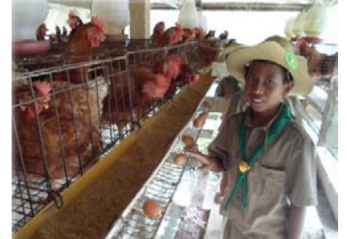
ร.ร. เป็นแหล่งเรียนรู้เศรษฐกิจพอเพียง