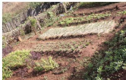
เป็นแหล่งเรียนรู้ด้านการเกษตรให้กับชุมชน