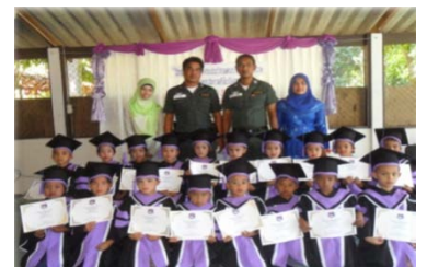
“ปู่ครู” ปัจจุบันสอนรุ่นลูกของลูกศิษย์