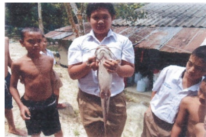
ขายผลผลิตสัตว์ไปยัง บ้านของ นร.