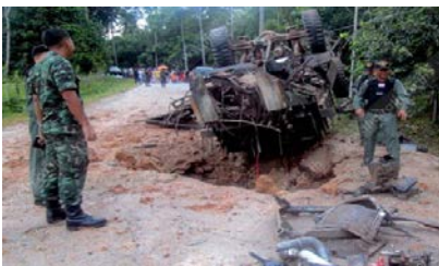
เหตุการณ์ความไม่สงบรุนแรงในพื้นที่ที่สอน