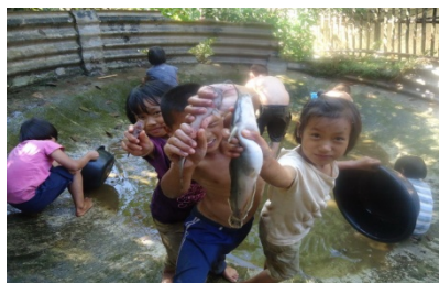
โครงการที่สอนน้อง