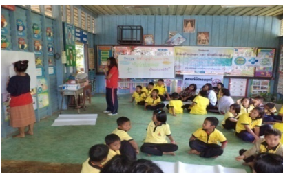
มมรรักการอ่านให้ นร. ใน ร.ร.