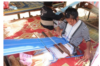
ส่งเสริมการอนุรักษ์การทอผ้า