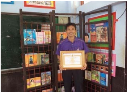
รับรางวัล OBEC AWARDS