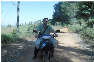
สอนในถิ่นทุรกันดารบนดอยสูง