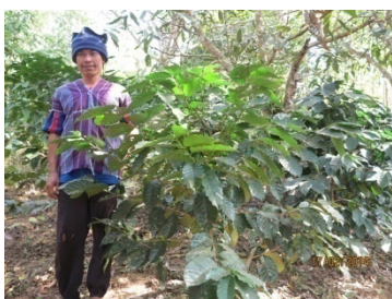
ส่งเสริมการปลูกกาแฟเพิ่มรายได้ให้กับชุมชน