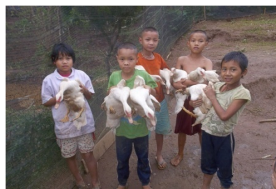
ส่งเสริมอาชีพเพื่อให้ นร. สามารถพึ่งพาตนเองได้อย่าง