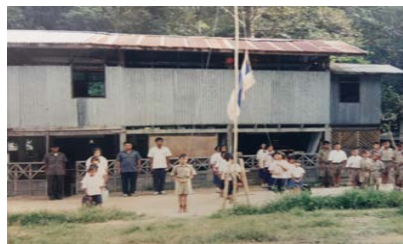
สอนมานานกว่า 24 ปี