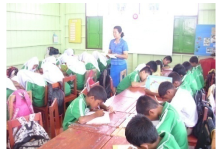
สอนพิเศษช่วงเช้า 7 โมง ใ้ นร. ที่ผลการเรียนไม่ดี