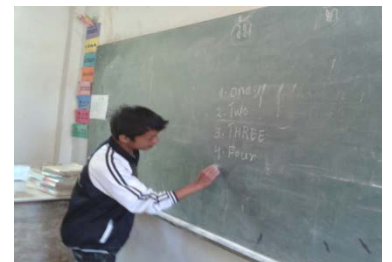
ริเริ่มจ้างครูสอนภาษาอังกฤษชาวพม่าช่วยสอน