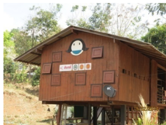
จัดสร้างอาคารพักนอนให้ นร.บ้านไกล