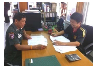
ประสานงานเรื่องขอสัญชาติให้