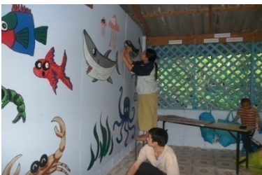
รูปที่วาดบนผนังห้องเรียน