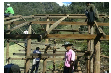
ริเริ่มสร้างห้องเรียนบ้านปางคามน้อย