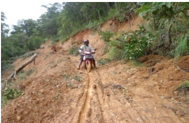
การเดินทางที่ยากลำบากในฤดูฝน