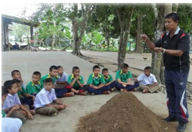
ส่งเสริมการเรียนด้านการเกษตรให้กับ