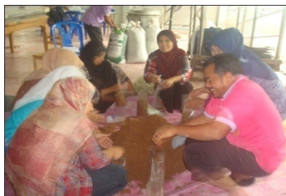
ส่งเสริมการเรียนรู้ด้านเศรษฐกิจพอเพียง