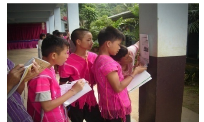
กิจกรรม “กระดาษหน้าที 2 ชวนน้องรักการ