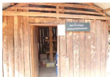
จัดตั้งสหกรณ์ร้านค้าบริการสินค้าราคา