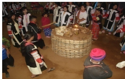
อนุรักษ์วัฒนธรรมชนเผ่า