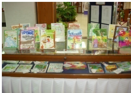
สื่อการเรียนจำนวนมากที่ครูเป็นผู้จัดทำ