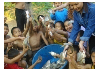
บริหารจัดการเกษตรเพื่ออาหารกลางวัน ได้ดี