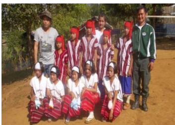
อนุรักษ์วัฒนธรรมชนเผ่า