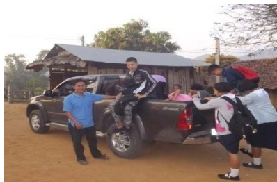
ประสาน ร.ร. ศึกษาสงเคราะห์ให้ นร. มีโอกาสเรียน