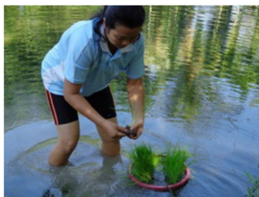
เป็นต้นแบบในการใช้หลักเศรษฐกิจพอเพียง