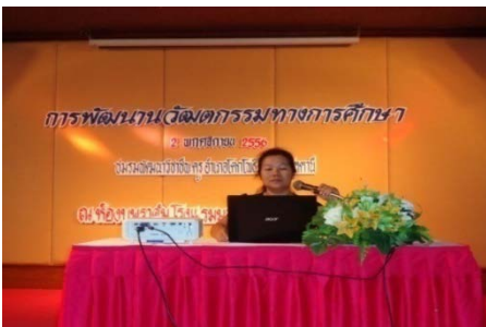
เป็นวิทยากรอบรมครูใน 3 จังหวัดชายแดนภาคใต้