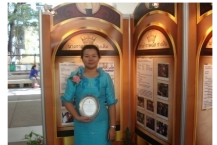
รับพระราชทาน โล่ครูเกียรติคุณ จากสมเด็จพระเทพรัตนฯ ในปี 2554