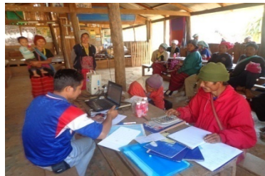
จัดตั้งกลุ่มออมทรัพย์ที่แข็งแกร่ง