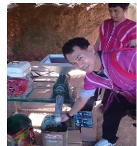
จัดตั้งโรงสีข้าวให้กับชุมชน