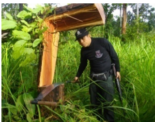
มุ่งมั่นแก้ปัญหายาเสพติดให้กับ ร.ร. และชุมชน