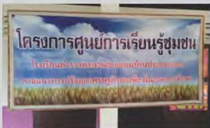
โรงเรียนเป็นศูนย์เรียนรู้เศรษฐกิจพอเพียง