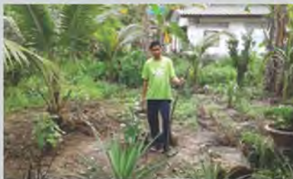
น้อมนำหลักปรัชญาเศรษฐกิจพอเพียง มาใช้ในการดำเนินชีวิต