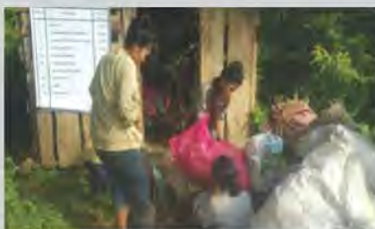
จัดตั้งโครงการธนาคารขยะ และขยายไปยังชุมชนข้างเคียง