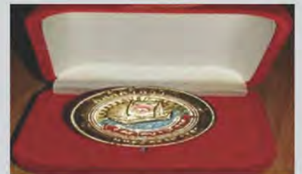
ได้รับรางวัลข้าราชการดีเด่นจากจังหวัดนราธิวาส