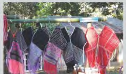
อนุรักษ์การใช้ลูกเดือยปัก ผ้าทอกะเหรี่ยง