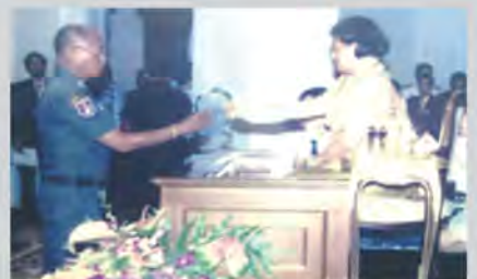
รับรางวัลครูใหญ่ดีเด่น จาก สมเด็จพระเทพรัตนราชสุดาฯ