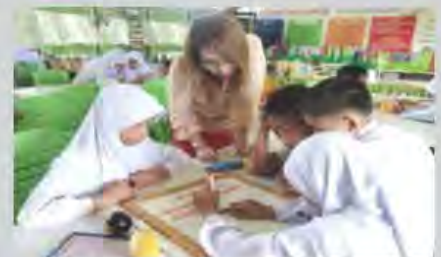
บูรณาการวิถีชุมชนในการสอนภาษาไทย