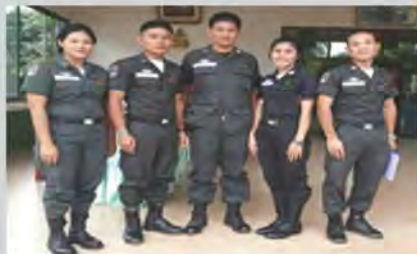
ลูกศิษย์ศึกษาจบกลับมาเป็นครูและพยาบาลจำนวนมาก