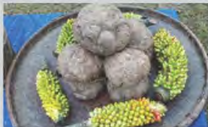
ส่งเสริมอาชีพ ร่วมกับการอนุรักษ์ป่า