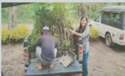
สนับสนุนโครงการสร้างป่าสร้างรายได้ ให้คนอยู่ร่วมกับป่าได้อย่างมีความสุข