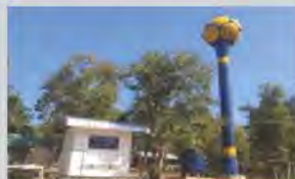
เป็นครูนักประสานหน่วยงานภายนอกช่วยโรงเรียนและชุมชน