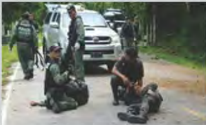
สอนในพื้นที่เสี่ยงภัย 3 จังหวัด ชายแดนใต้มานานกว่า 14 ปี