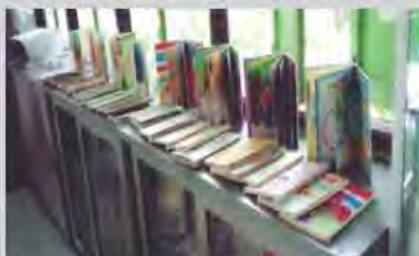
จัดทำหนังสือเล่มเล็ก สร้างภูมิคุ้มกัน เสาร์กับฮะดีด ในการแก้ปัญหาเสพติด