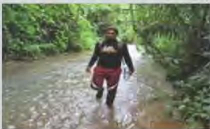
สอนหนังสือให้เด็กด้อยโอกาส ในป่าทุ่งใหญ่นเรศวรกว่า 9 ปี