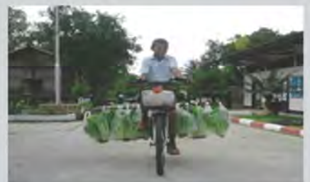
พักไฮโดรโปนิกส์สร้างรายได้ให้กับนักเรียน