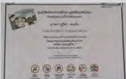
นร.มุสลิม ได้รับรางวัลชนะเลิศ ด้านการใช้ภาษาไทย