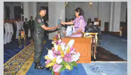
ได้รับรางวัลดีเด่นระดับประเทศด้านการเกษตรและปศุสัตว์