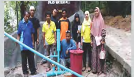
นวัตกรรมเครื่องตะบันน้ำ