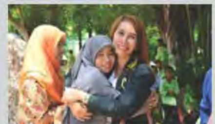
ได้รับการยอมรับจากชุมชน และผู้ปกครองนักเรียน