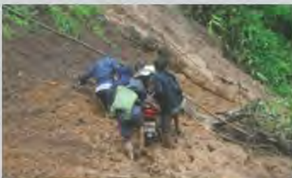
สอนหนังสือบนดอยสูงชัน ทุรกันดารมานานกว่า 15 ปี