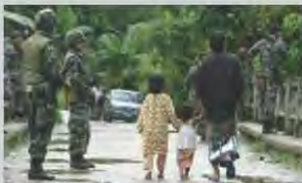
สอนในพื้นที่เสี่ยงภัย 3 จังหวัด ชายแดนใต้ มายาวนานกว่า 32 ปี