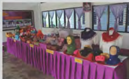
ส่งเสริมอาชีพให้กลุ่มแม่บ้าน เช่นการทำผักคลุมพม