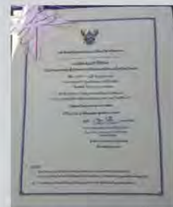
จัดตั้งวิสาหกิจชุมชนเพื่อความยั่งยืน