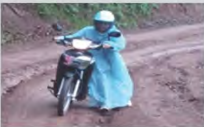
สอนหนังสือบนดอยสูง ในพื้นที่เสี่ยงภัย กว่า 18 ปี