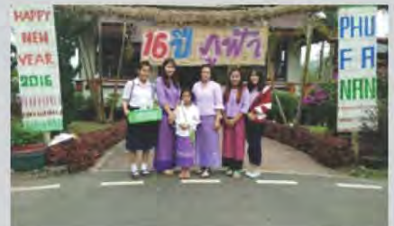
รับพิชชอบโครงการในพระราชดำริ สมเด็จพระเทพรัตนราชสุดาฯ