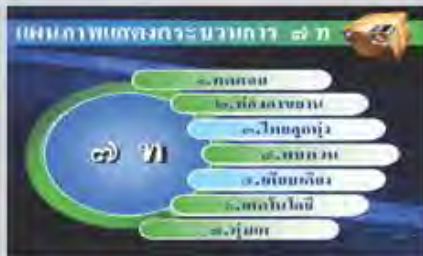
ริเริ่มนวัตกรรม 7ท.model ในการสอนภาษาไทย