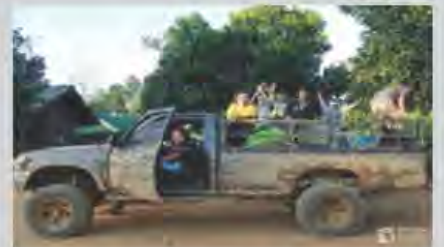
ดูแลนักเรียนบ้านไกล 30 คน