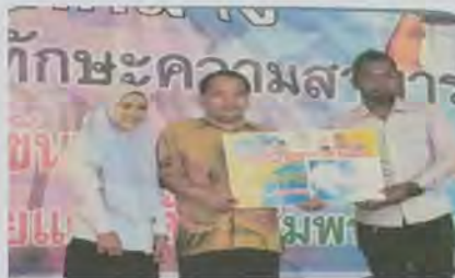
ริเริ่มนวัตกรรม STEAM มาใช้ใน กระบวนการเรียนรู้