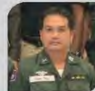
ดานตำรวจสมดุขัย โพอิน ครูใหญ่โรงเรียนตำรวจตระเวนชายแดน บ้านทรายเอื้อง อำเภออุ้มผาง จังหวัดตาก