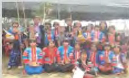
สอนหนังสือให้เด็กชาวเขามนดอยสูงนานกว่า 14 ปี