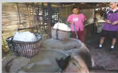
บูรณาการ ภูมิปัญญาท้องถิ่น มาใช้ในการเรียนการสอน