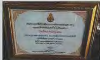
คิดค้นการนำภาษาไทยมาแก้โจทย์คณิตศาสตร์