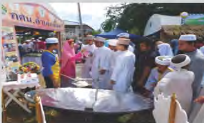
นวัตกรรมเต้าพพลังงานแสงอาทิตย์ แบบพาราโบลา