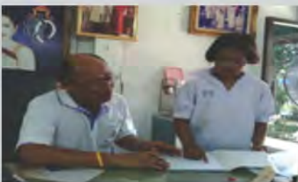
สอนหนังสือในพื้นที่ เสี่ยงภัยมานานกว่า 25 ปี