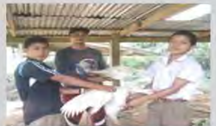
ส่งเสริมงานด้านปศุสัตว์ให้กับชาวบ้าน