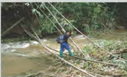
สอนหนังสือในป่าลึกมายาวนานกว่า 22 ปี