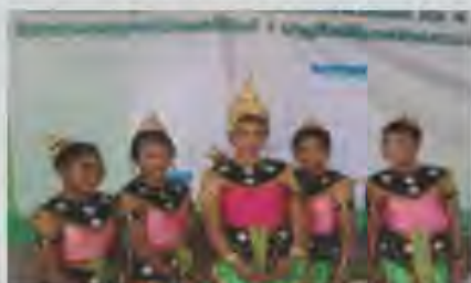
นักเรียนได้รับรางวัล ด้านการใช้ภาษาไทยระดับต่างๆ จำนวนมาก