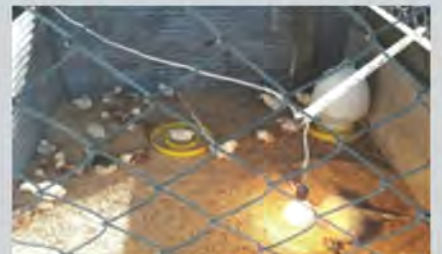
ร.ร. สามารถผลิตพ่อพันธุ์และแม่พันธุ์ ไก่ไข่ได้ออ