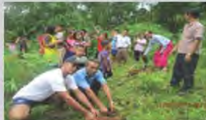
จัดหาพันธุ์พืช พันธุ์สัตว์ให้กับชาวบ้าน