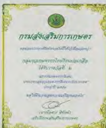
นร.ได้รับรางวัลขุวเกษตรระดับประเทศ