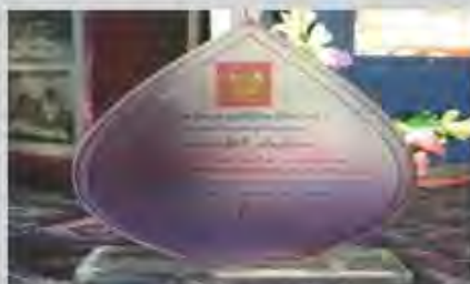
เป็นโรงเรียนต้นแบบปลอดยาเสพติด ได้รับรางวัล เสมา ปปส.