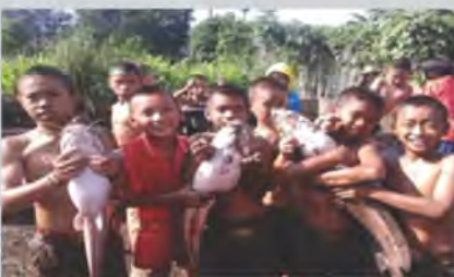
ขยายผลงานปศุสัตว์ไปสู่ชุมชน