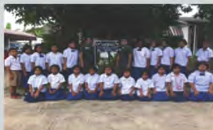
ผล o-net ภาษาไทยของนักเรียน สูงกว่ามาตรฐานประเทศ