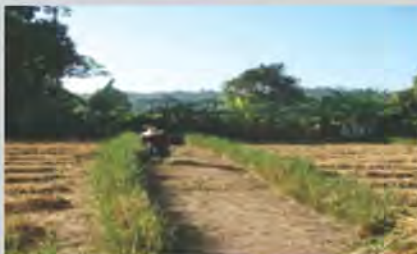
โรงเรียนต้นแบบหญ้าแฝกระดับประเทศ