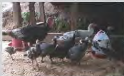
ริเริ่มการเลี้ยงสัตว์กว่า 10 ชนิดในโรงเรียน