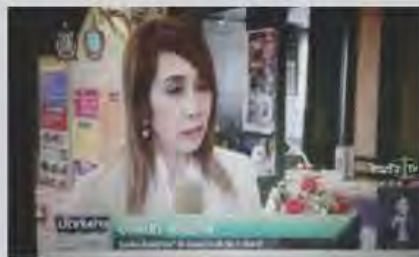
สัมภาษณ์บนเวที ในวชิรธรรม การสอนภาษาไทยของครู