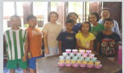
ขยายผลโครงการทางวิทยาศาสตร์ สร้างรายได้ให้กับชุมชน