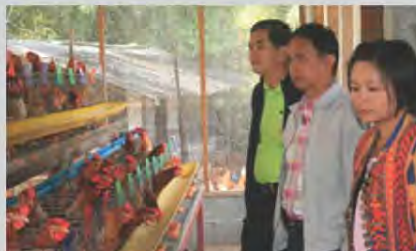
รับรางวัลครูปศุสัตว์ ดีเด่นระดับประเทศ